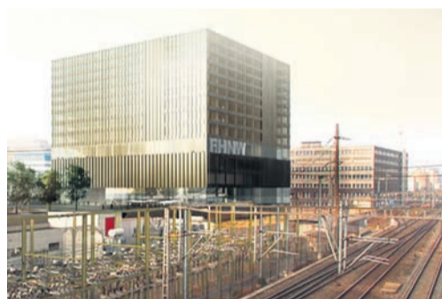
Der Entwurf für den Muttenzer Campus.

Im Neubau untergebracht werden sollen die Hochschulen für Architektur, Bau und Geomatik, Life Science, Soziale Arbeit, die Hochschule für Soziale Arbeit sowie der Trinationale Lehrgang Mechatronik. Im Gegenzug können Räume an diversen Aussenstandorten in Liestal, Muttenz und in Basel geschlossen werden. Den Projektierungskredit in der Höhe von 32,5 Mio. Franken hat der Landrat im Mai 2010 bewilligt. Gegenwärtig ist die Projektierung in Gang. Der Bau soll von 2013 bis 2016 realisiert und im Frühling 2017 bezogen werden können. Über den Baukredit wird das Baselparlament befinden, wenn das Ausführungsprojekt vorliegt.