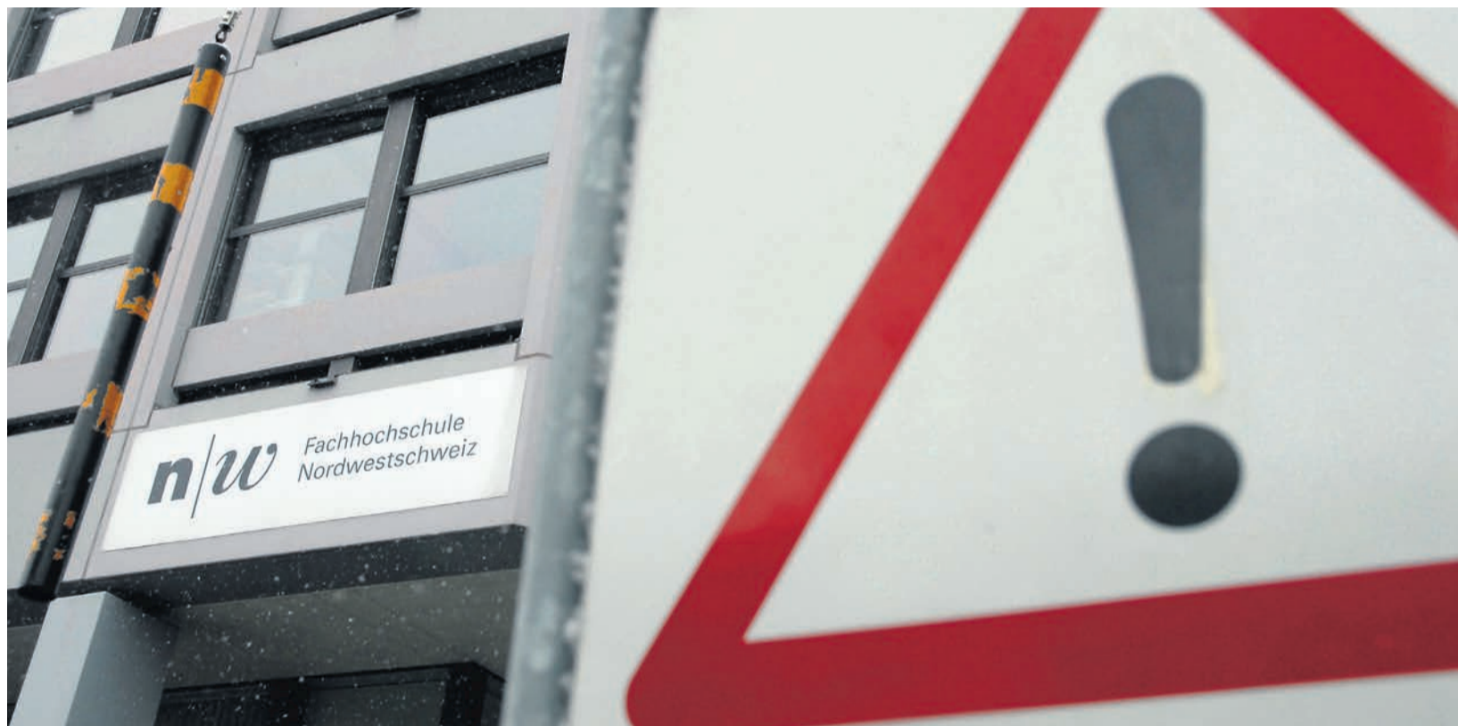
Mit seinem «Ja, aber...» hat der Baselbieter Landrat der Fachhochschule Nordwestschweiz einen Warnschuss vor den Bug gesetzt. An seine Zustimmung zum Globalbudget 2012 bis 2014 knüpfte das Parlament den Auftrag, die Kostensteigerung einzudämmen.

Die steigenden Kosten der Fachhochschule Nordwestschweiz (FHNW) haben Ende vergangenen Jahres für eine turbulente Landratsdebatte gesorgt. Erst im zweiten Anlauf hat das Baselbieter Parlament das Globalbudget der FHNW für die Jahre 2012 bis 2014 beziehungsweise für den Baselbieter Anteil von 187 Millionen Franken gutgeheissen. An das Ja geknüpft hat der Landrat den Auftrag an die Fachhochschulleitung, Vorschläge auf den Tisch zu legen, wie der stetige Kostenanstieg der vierkantonalen Institution mit rund