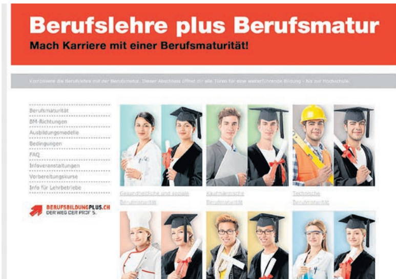
Alle Infos zur Kampagne und zur Berufsmatur gibt es auf www.berufsmaturbb.ch .

Die Imagekampagne «Berufslehre plus Berufsmatur» wirbt mit Plakaten, Inseraten und anderen Werbemitteln sowie mit zahlreichen Anläs-