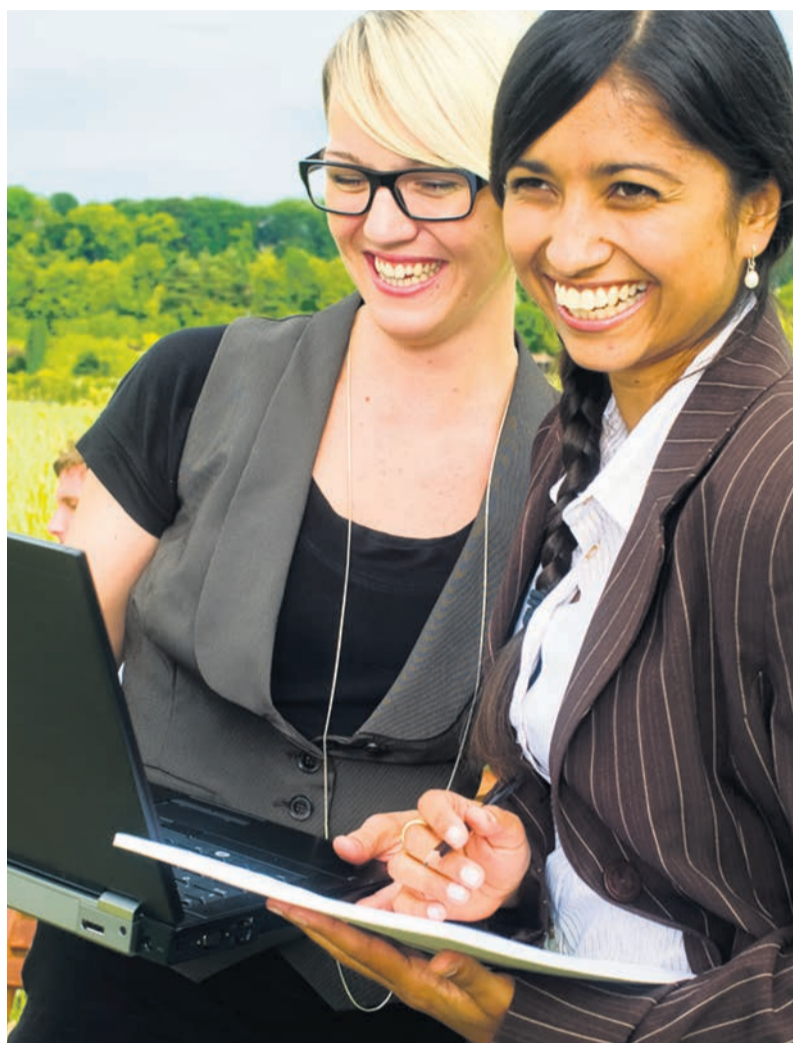
Unternehmen in der Region liefern Ideen und Problemstellungen, Studierende der Hochschule für Wirtschaft lösen diese praxisorientiert.

Unter dem Titel «Konzeption eines Controlling-Systems zur internen Optimierung der Finanzen» hat ein weiteres Studierenden-Team für ein Jungunternehmen im Dienstleistungssektor ein Konzept zur Anpassung und Optimierung des Rechnungswesens erstellt. Besonders für