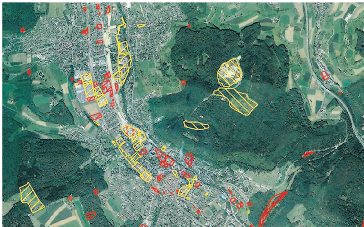
Altlastenkataster Liestal und Umgebung: Standorte in Abklärung sind gelb markiert, belastete Standorte rot.

Das Ziel, die Gesamtheit der belasteten Standorte in der Schweiz zu erfassen und zu bewerten, brachte auf Seiten der Behörden erwartungsgemäss einen immensen Initialaufwand mit sich. Die kantonalen Umweltämter mussten ihre Ressourcen entsprechend aufstocken und die Umsetzung der Gesetzgebung erfolgte in einigen Kantonen der Schweiz – so auch in Baselland – mit einiger Verzögerung. Die ersten Resultate dieser Anstrengungen: Rund 50'000 Standorte in der Schweiz fielen unter den Verdacht, mit Schadstoffen belastet zu sein. Auf den Kanton Baselland fielen nach Abschluss der Katastererstellung