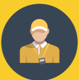
BERUFSBILDNERINNEN UND BERUFSBILDNER