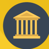
VERTRETUNGEN AUS POLITIK UND VERWALTUNG