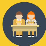
SCHÜLERINNEN UND SCHÜLER